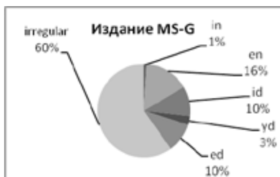
Рис. 4. Виды морфов в издании MS-G

Несмотря на множество вариаций форм в издании G, согласно статистическим данным можно сказать, что издания MS-F и MS-G очень похожи по наличию идентичных по форме окончаний, которые немного совпадают по количественной характеристике: MS-F: -en (6%), -id (2%), -yd(e) (5%), -ed (16%) и сильные глаголы с чередованием в корне (71%). и MS-G: in – 5 (1%), -en – 46 (15%), -id – 32 (10%), -yd – 9 (3%), -ed – 31 (10%), сильные глаголы с чередованием в корне – 180