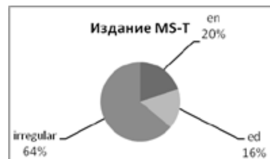
Рис. 2 Виды морфов в издании MS-T