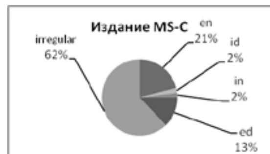
Рис. 1. Виды морфов в издании MS-C

Сравнивая четыре издания, сразу бросается в глаза невероятное отличие изданий MS-G и MS-T от всех остальных. Издание MS-G, которое относится к северному диалекту (скандинавское влияние), содержит множество вариаций форм прошедшего причастия и показывает настоящую картину беспорядка, в которых сложно выделить единую систему.