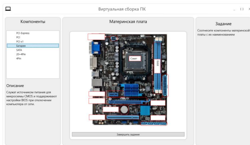
Рис. 3. Окно «Изучение компонентов материнской платы» Fig. 3. Window «Study of motherboard components»

На рисунке 2 изображен процесс выполнения задания «Подключение оборудования к системному блоку». Студенту необходимо изучить порты системного блока и определить соответствие порта его графическому изображению.