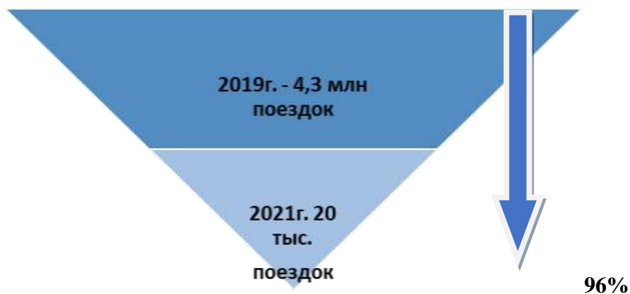
Рис. 3. Динамика падения въездного туристского потока в РФ Fig. 3. The dynamics of the decline in the inbound tourist flow in the Russian Federation

субсидии на заработную плату сотрудникам туристских компаний (в размере 1 МРОТ на сотрудника).