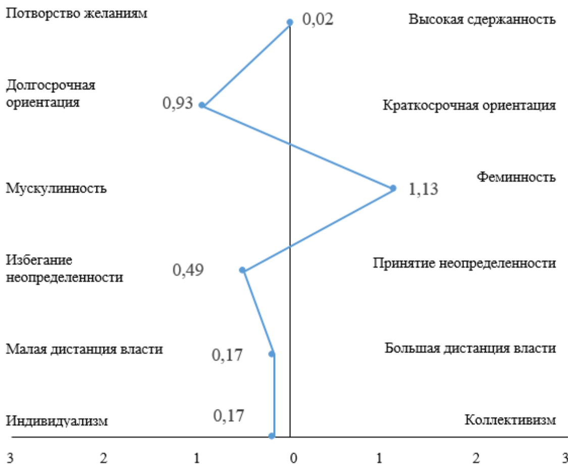
Рис. 1. Общий психологический профиль респондентов Fig. 1. General psychological profile of respondents

В целом по выборке по шкале «индивидуализм – коллективизм» мы получили практически срединное значение с небольшим отклонением (0,17) в сторону индивидуализма. Это означает, что говорить о коллективистском мировоззрении, которое считается традиционным для российской культуры, в отношении современных российских студентов не приходится. Следует признать, что сегодня мы постепенно «дрейфуем» в сторону индивидуализма, причем наиболее явно это проявляется в молодежной среде. Существует множество причин, объясняющих это явление. Российское общество за последние десятилетия пережило множество кризисов. Возьмем хотя бы так называемую перестройку, когда люди, привыкшие жить с опорой и