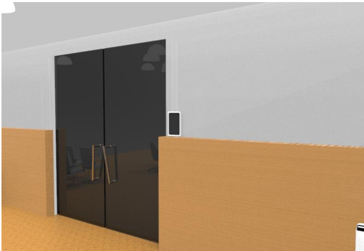
Рис. 6. Расположение устройства управления подсистемами освещения, кондиционирования и отопления в интеллектуальном зале совещаний