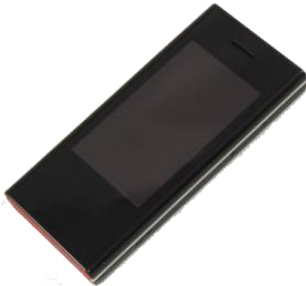
Рис. 5. Внешний вид устройства управления подсистемами освещения, кондиционирования и отопления интеллектуального зала совещаний

Устройство предназначено для беспроводного управления подсистемами освещения, кондиционирования и отопления интеллектуального зала совещаний с использованием сенсорного ввода и получения информации о состоянии указанных подсистем с их последующим выводом на ЖК-экран (рис. 5).