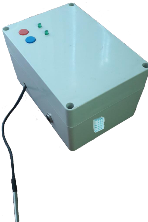
Рис. 3. Внешний вид исполнительного модуля подсистемы отопления Fig. 3. External view of the heating subsystem executive module

Исполнительный модуль подсистемы отопления предназначен для управления вентилем радиатора отопления, установленного в интеллектуальном зале совещаний, для обеспечения комфортного температурного режима в нем (рис. 3).