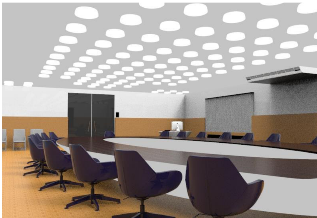
Рис. 1. Визуальное представление интеллектуального зала совещаний