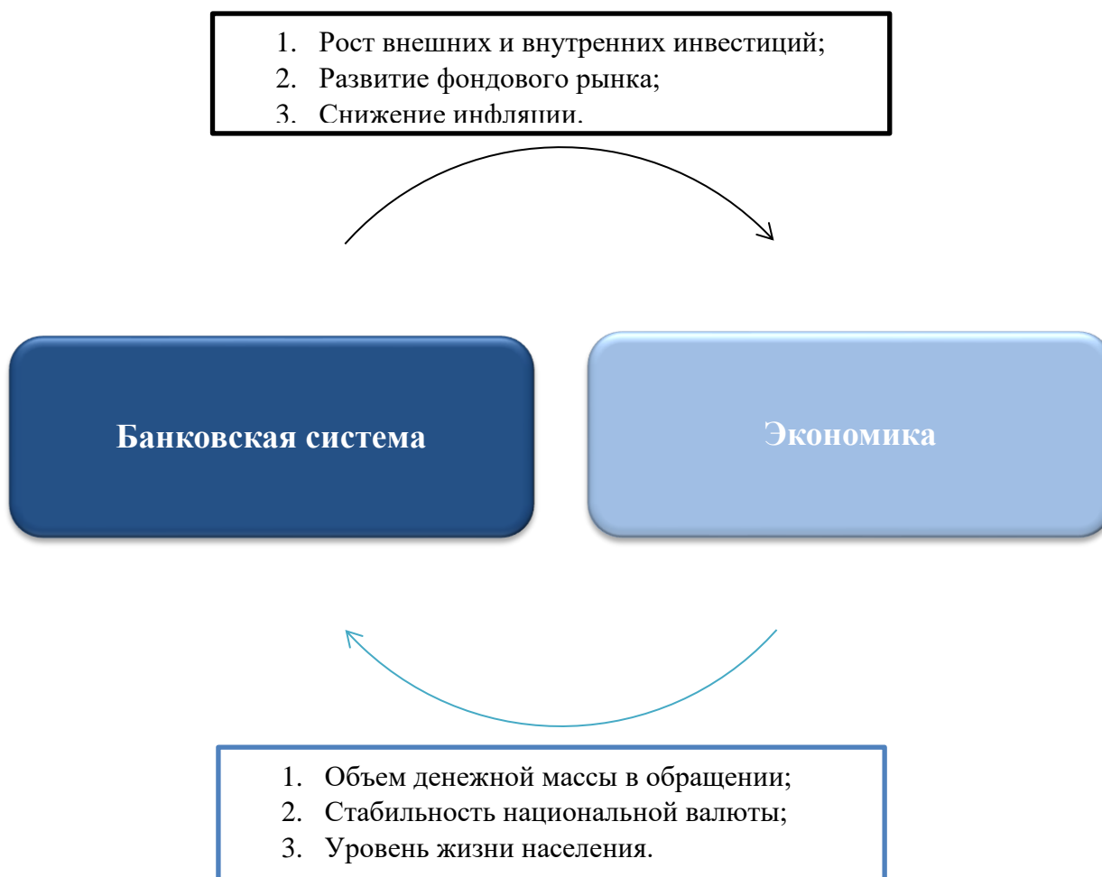
Рис. 2. Взаимосвязь банковского сектора и экономики РФ Fig. 2. The relationship between the banking sector and the Russian economy